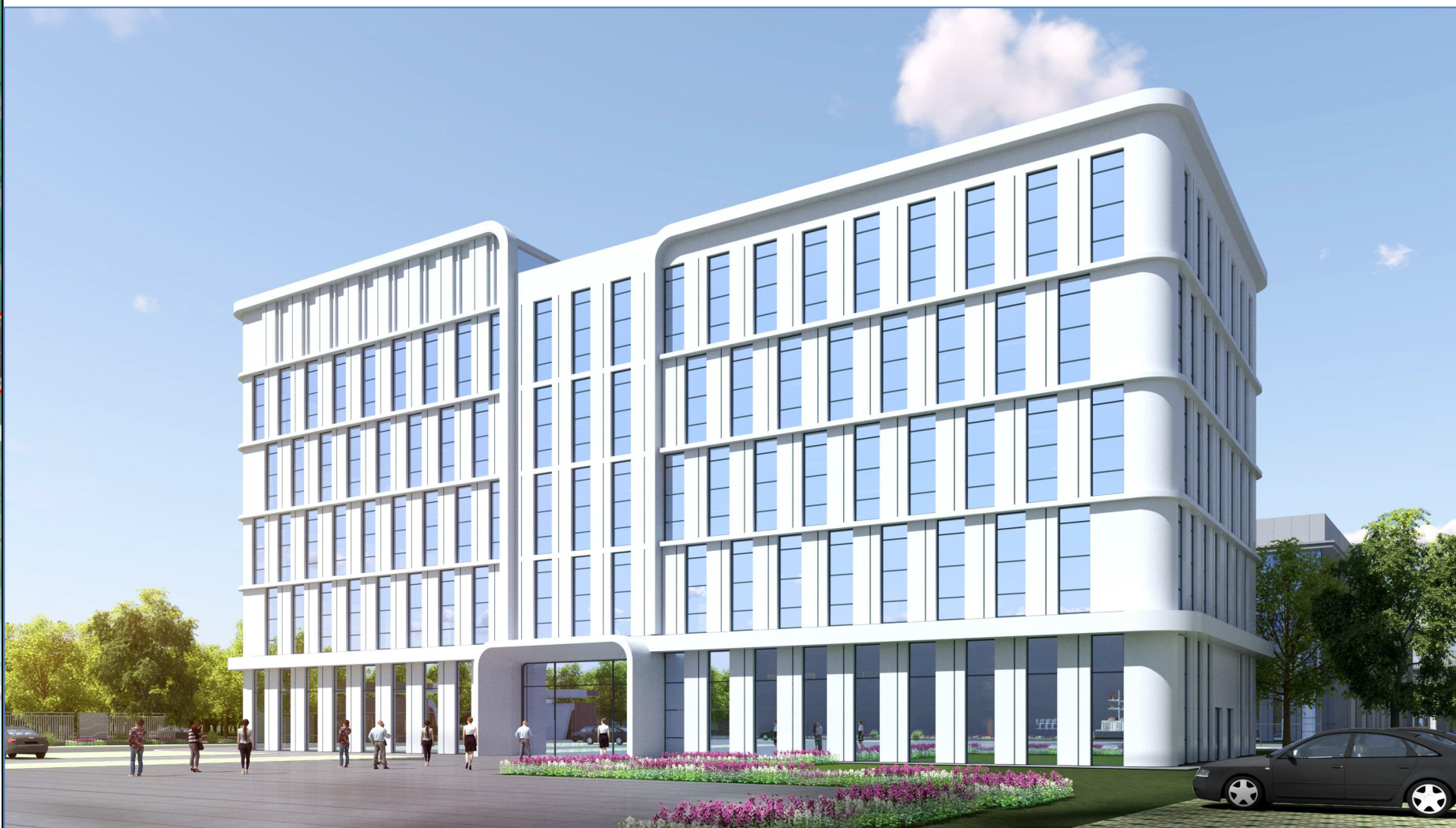
调整后办公楼效果图