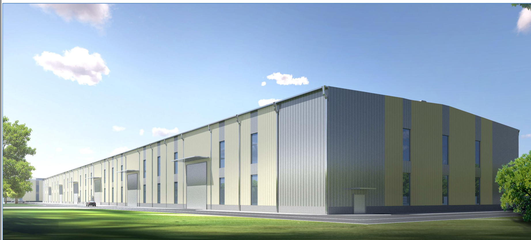
调整后厂房效果图