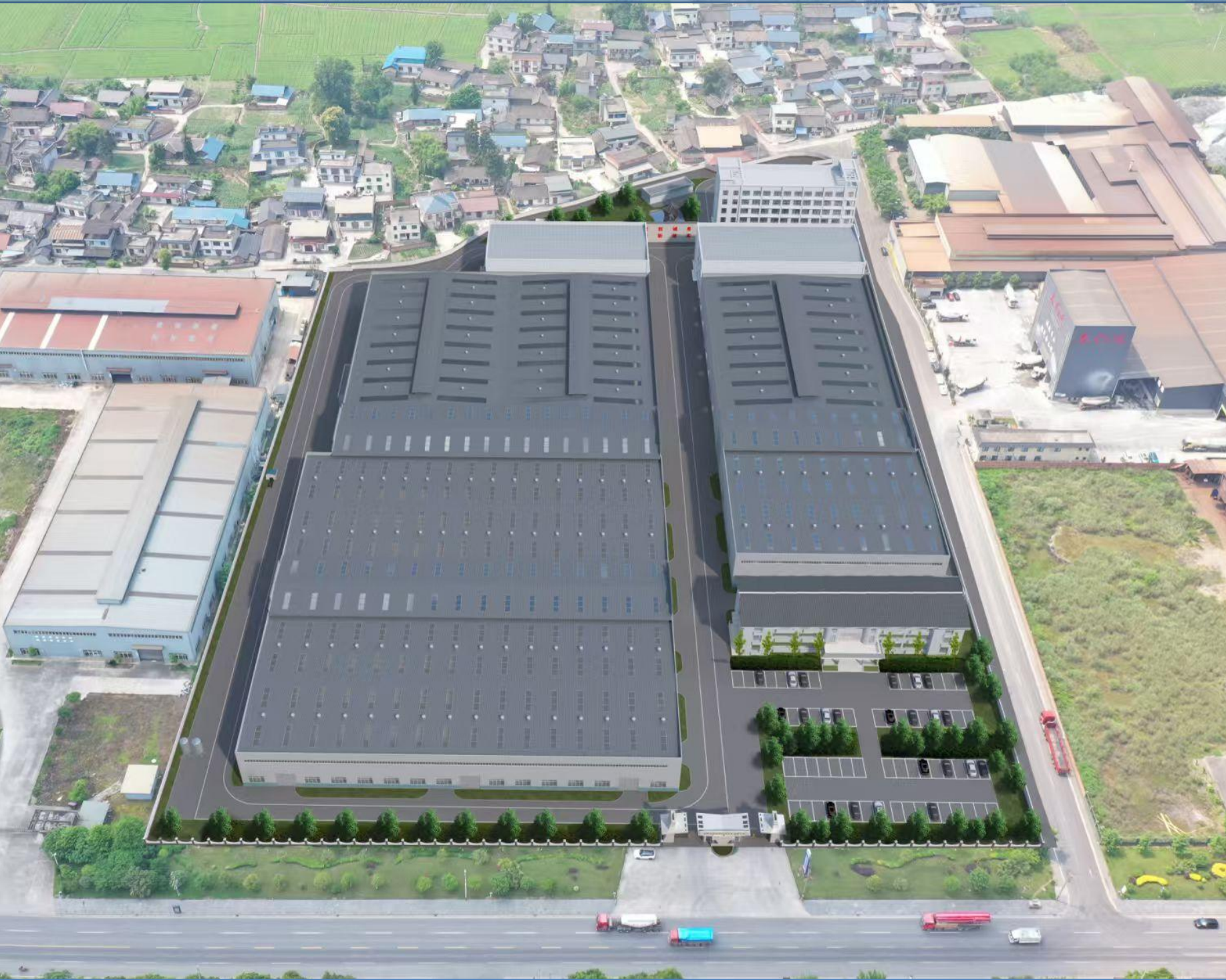
调整后实景鸟瞰图

调整内容： 一、科研综合楼调整： 1、屋面造型、屋面高度、内部布局、空调格栅对应调整。 2、建筑面积由2834.1平方米调整为2679.14平方米，计容面积由2834.1平方米调整为2729.18平方米；占地面积由981.2平方米调整为927.30平方米。 二、在原有1号厂房右侧新增两台成品设备，共计占地43.63平方米。 三、总指标调整： 1、项目总占地面积由31381.09平方米调整为31370.82平方米，建筑系数由56.4%调整为56.3%。 2、项目总建筑面积由41657.04平方米调整至41502.08平方米；总计容面积由67664.18平方米调整至67559.26平方米，容积率由1.22调整为1.21。