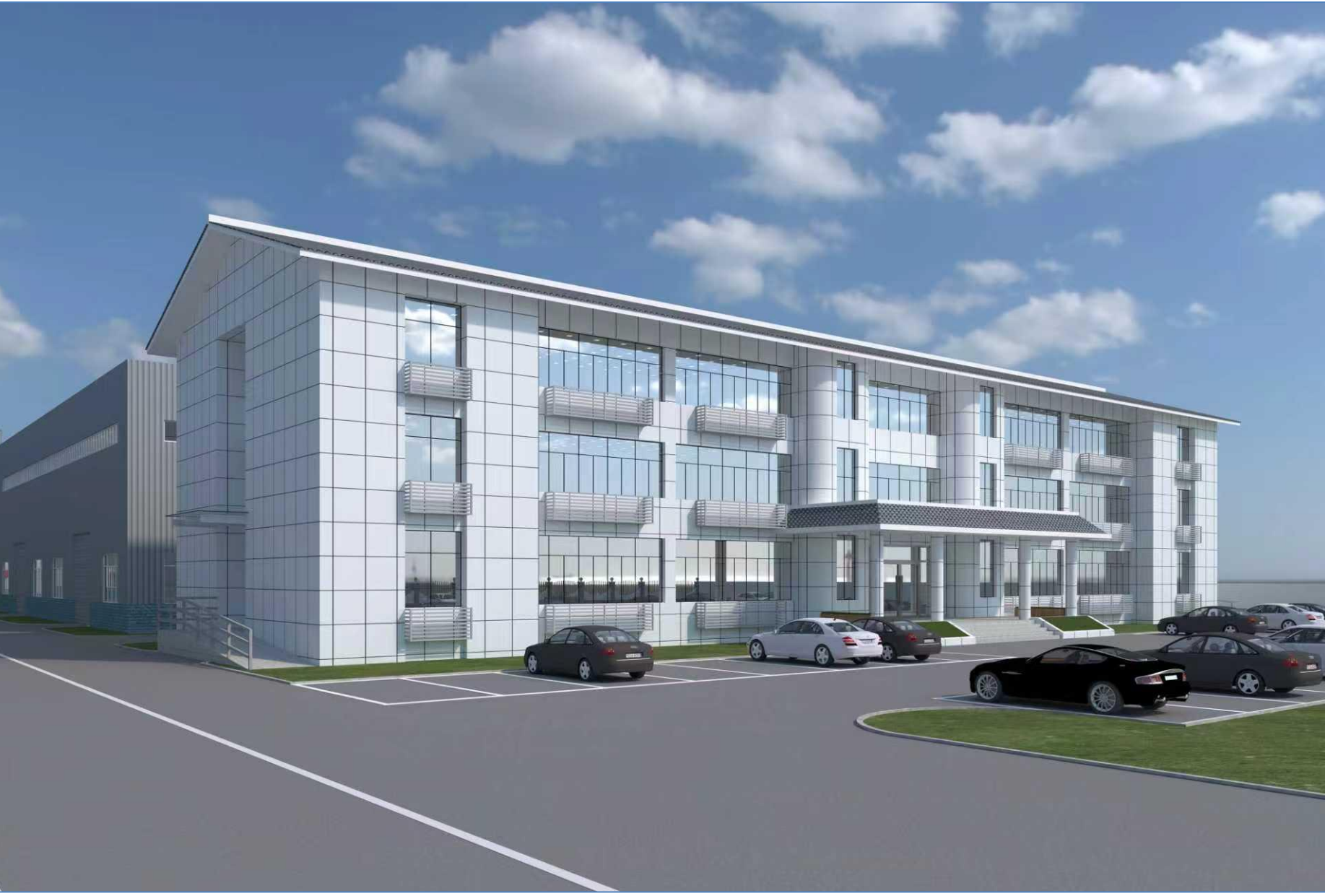
调整后科研楼效果图